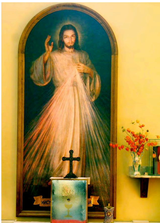
Фото 17. Николаев, 2009 г. Икона Иисуса Христа в римско-католическом храме Святого Иосифа