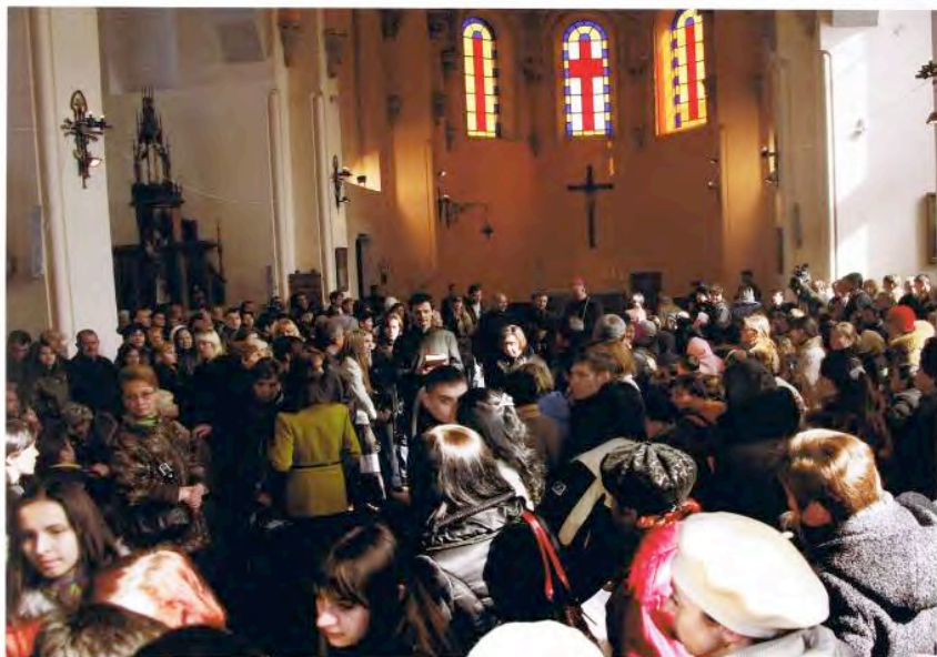
Фото 13. Николаев, 2009 г. При передвижении к мемориальной доске мы испытывали некоторые трудности, народу собралось очень много

Освящение доски привлекло внимание фоторепортёров местных газет и журналов, кинооператоров, фотолюбителей, спешивших увековечить этот значимый в жизни всего города момент.