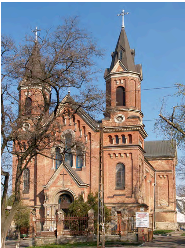
Фото 8. Николаев, 2009 г. Римско-католическая церковь Святого Иосифа

Среди верующих проводится большая социальная работа: при церкви начал свою работу «Францисканский Орден Мирян», «Легион Марии», «Каритас», члены которых навещают и ухаживают за больными, снабжают их продуктами и медикаментами, посещают дома престарелых. Орден оказывает медицинскую помощь бездомным, реализует программы помощи инвалидам. Большая работа проводится с цыганскими детьми, обеспечивают их одеждой, организуют для них летний отдых, устраивают в интернат и занимается многими другими видами благотворительной деятельности.