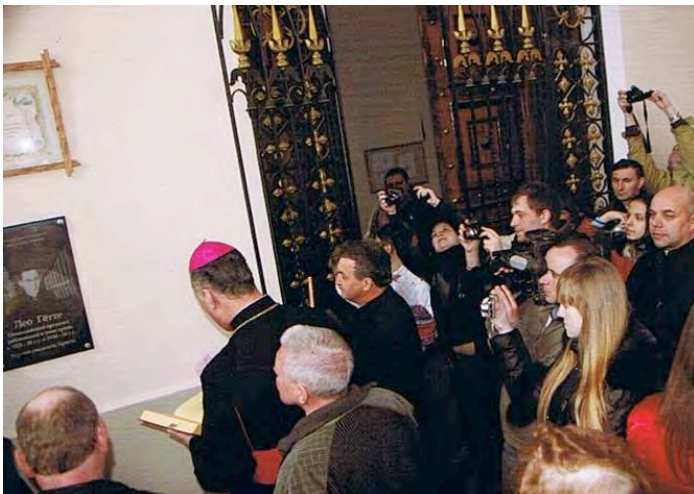
Фото 15. Николаев, 2009 г. Освящение доски привлекло внимание многих фоторепортёров, кинооператоров, журналистов