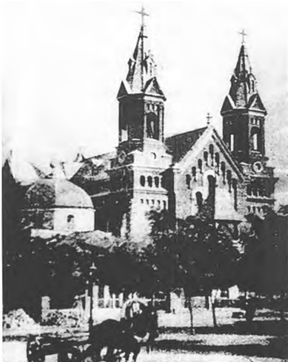
Фото 1. Николаевская римско-католическая церковь Святого Иосифа.

Римско-католическая церковь в городе Николаеве была построена на средства прихожан в мае 1794 года для чинов морского ведомства католического вероисповедания. Со временем здание стало разрушаться и в 1890 году рядом с ним заложили новое. Причём часть