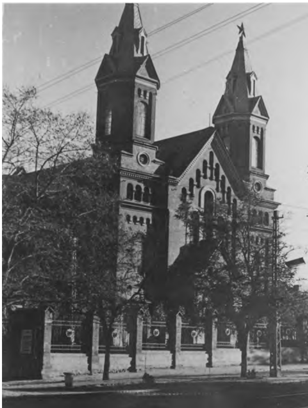
Фото 5. Николаевская римско-католическая церковь Святого Иосифа в годы советской власти

В 1934 году было ликвидировано и Приходское человеколюбивое общество при римско-католической церкви, его здание по улице Декабристов, 32 передано Историко-археологическому музею. 19