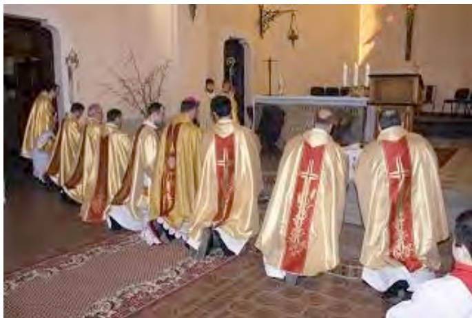
Фото 10. Николаев, 2009 г. Торжественная литургия в римско-католическом храме Святого Иосифа