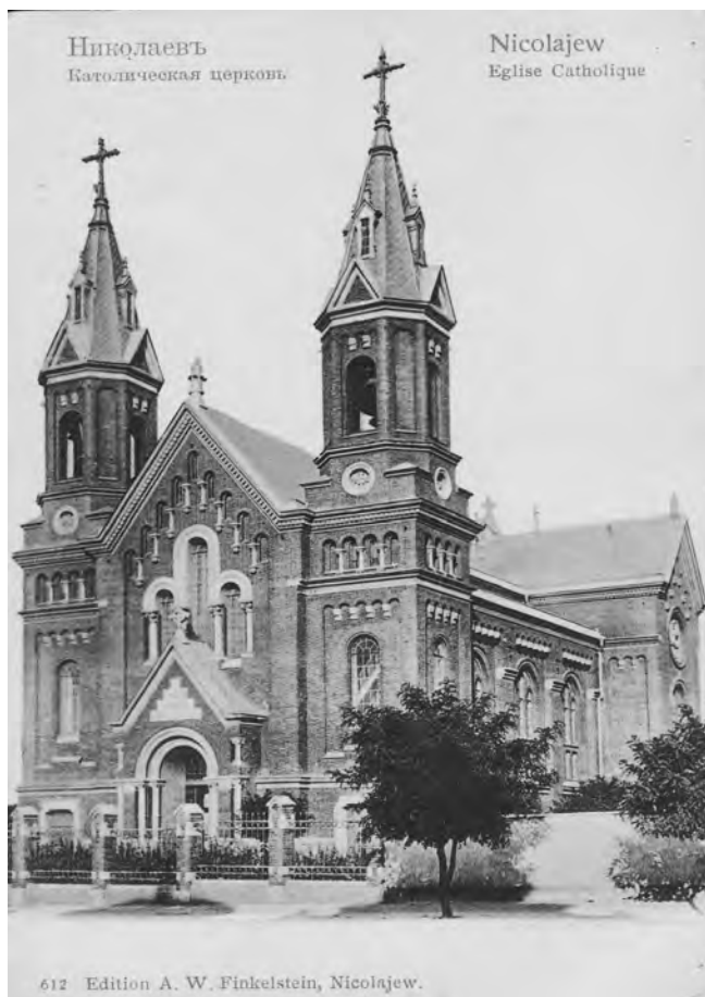
Фото 2. Николаевская римско-католическая церковь Святого Иосифа в начале 20-го века 7

приходского одноклассного 6 училища при Николаевской римско-католической церкви. Оно было устроено для детей прихожан, проживавших на окраине г. Николаева, называемой «Польская слободка».